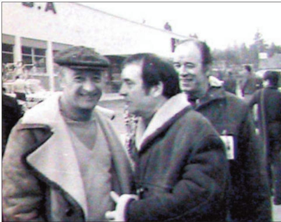
Le 11 mars 1971, de g. à dr. : Michel Audiard, Jean Carmet et André Pousse réunis à Dourdan, pour le départ de "Paris-Nice".