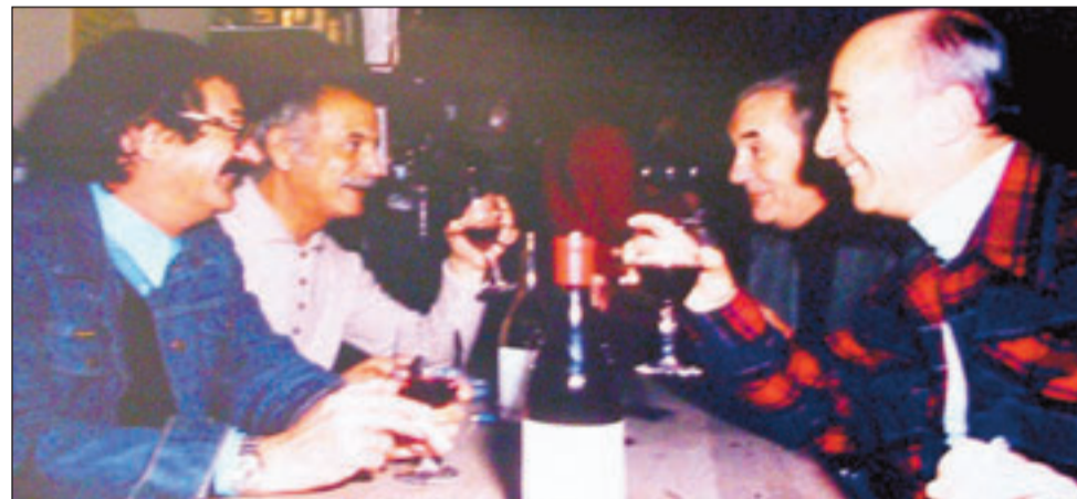
Trio de stars, avec Brassens (à g.) qui trinque avec Michel Audiard et Jean Carmet.