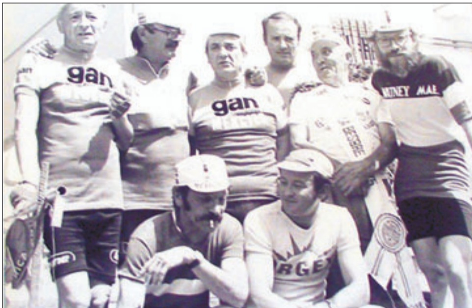
En 1975, aux "Boucles de la Besbre", Michel Audiard (à g., en maillot Gan) et Jean Carmet (au centre) ont fait équipe, comme très souvent. Ils étaient inséparables.