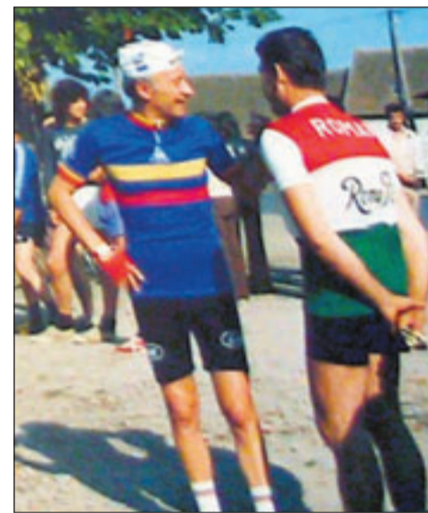
Michel Audiard dans la belle casaque colorée du club de Dourdan, qu'il a incité à recréer.