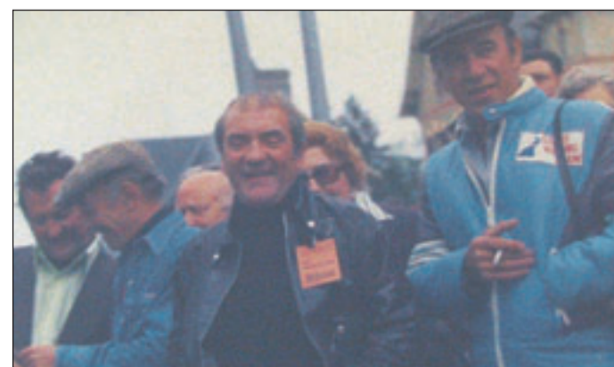
De g. à dr. : Michel Audiard, Jean Carmet et André Pousse à l'arrivée du Paris-Bagnoles-de-l'Orne, en 1975.