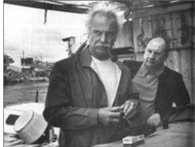
Il s se sont connus au S.T.O. et ne se sont jamais quittés avec les autres “copains d’Allemagne”.

C’était le lieu de réception habituel. C’était table ouverte pour tous les amis. Avec Georges c’était les copains d’abord. La fiesta quoi. En plus de la maison principale il y avait les reste d’une minoterie. Le pianiste de Bobby Lapointe l’occupait et Bobby Lapointe venait répéter là. Georges recevait énormément de gens, tout le gratin du métier, Aznavour, Béart. Un jour Guy Béart nous a même amené Pompidou à la maison ! Tous les grands artistes sont passés par Crespières. En dehors de ça, Georges recevait toujours les anonymes. Il ne faisait pas