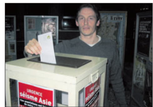
Des urnes ont été installées dans les mairies, comme ici à Evry.

Les mairies de l'Essonne s'équipent d'urnes, qu'elles disposent à l'entrée de l'hôtel de ville. C'est le cas à Evry, où la municipalité a installé une urne de collecte dans chacune des quatre mairies, principale et annexes. par ailleurs, la Ville d'Evry organise une Soirée de la solidarité samedi 15 janvier, de 18 h à 22 h, à l'hôtel de ville. le prix d'entrée (5 euros, minimum) par famille sera consacré d'une part, à la création d'une structure d'accueil pour les veuves et orphelins en Inde et, d'autre part, à la reconstruction d'une école au Sri Lanka. Animations, spectacles et dégustation de produits artisanaux sur place.