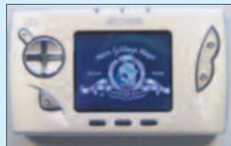
Le fabricant français Archos commercialise un baladeur numérique capable de lire et stocker sons et vidéos. Idéal pour "piller" les albums et films d'un ami en vous branchant sur son ordinateur.

La loi autorise de fabriquer et commercialiser des appareils conçus pour lire tous les formats de compression numériques. Certes l'utilisateur peut se contenter d'y copier les CD et DVD qu'il a achetés, mais la réalité est en général toute autre. Après l'iPod, l'Archos enrichit l'arsenal du parfait pirate. A peine plus gros qu'un téléphone mobile, il permet de stocker et lire la plupart des formats audios et vidéos. Quelques minutes suffisent pour télécharger dessus des dizaines d'albums. Et demain, lorsque nous réceptionnerons la radio en numérique via notre mobile, ou lorsque les salles de cinéma diffuseront leurs films en numérique par satellite, d'autres moyens encore existeront pour pirater.