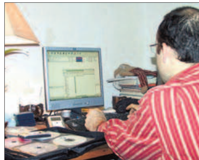
Téléchargement en ligne, puis stockage sur un baladeur et gravage sur CD vierge... manuel d'un bon pirate.