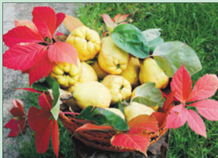
Le coing est un des fruits qui a le moins évolué au fil des siècles.