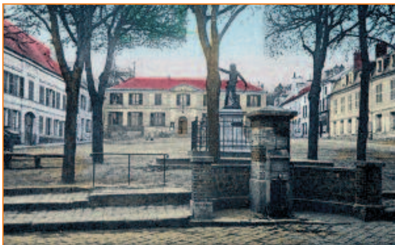
Anciennement place de l'Hôtel-de-Ville à Palaiseau, la place de la Victoire a en partie aujourd'hui conservé son cachet d'antan, malgré de récents travaux.

• www.notrefamille.com (rubrique 'Villes et villages').