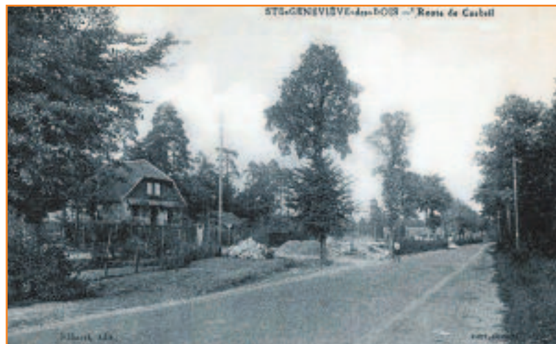
La route de Corbeil à Sainte-Geneviève-des-Bois est restée un axe nord-sud important dans le département... en moins champêtre.