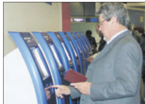
42 bornes libre-service à l'entrée et dans le hall 2 permettent aux passagers de s'enregistrer eux-mêmes s'ils le souhaitent.

* Aéroports de Paris prévoit d'augmenter et d'ouvrir son capital à hauteur de 49%. L'Etat resterait majoritaire à hauteur de 51%. Le lancement en bourse devrait intervenir avant l'été 2006.