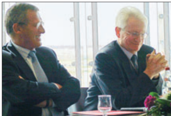
A gauche, Jean-Cyril Spinetta, PDG d'Air France, et Pierre Graff, PDG d'Aéroports de Paris.

flux de passagers. Ce gain de flexibilité permet, en cas d'affluence notamment, de dédier des banques d'enregistrement à une catégorie de passagers (personnes à mobilité réduite, enfants voyageant seuls...). Quant aux postes d'inspection filtrage (passage aux portillons de sécurité), ils ont tous été regroupés au fond du hall, ce qui devrait, là encore, permettre