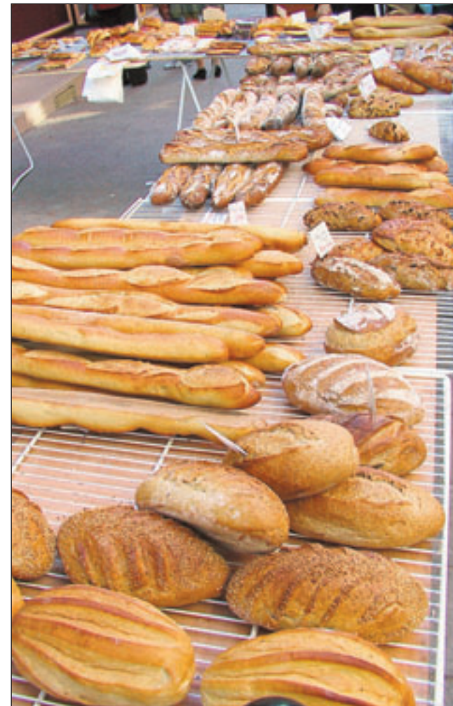
81 % des personnes interrogées estiment que l'offre de produits vendus en boulangerie est assez diversifiée. Ici, le stand extérieur de la boulangerie Pautret, à Palaiseau.

Pour plus de la moitié (59 %) des personnes interrogées, le pain ne contient pas d'additifs alimentaires. Mais, lorsqu'on pose la même