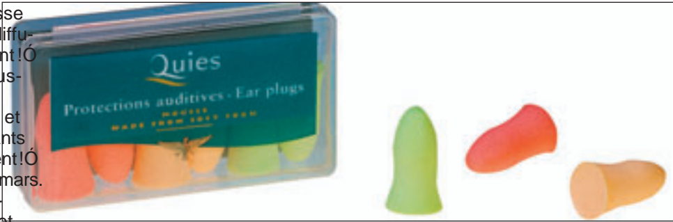
Idéales en concert, les protections auditives en mousse permettent d'atténuer jusqu'à 35 dB.

La célèbre boule Quies a été inventée par un pharmacien parisien en 1918 et est devenue la référence dans les concerts, les protections auditives en mousse aux couleurs fluorescentes sont parfaitement adaptées à l'oreille humaine. Cette PME française a été rachetée par la marque Quies qui commercialise deux modèles particuliers : les protections auditives en mousse Quies et les protections auditives en mousse Quies. Elles sont disponibles en 3,16 euros la boîte de 7 paires et en 4,48 euros la boîte de 3 paires.