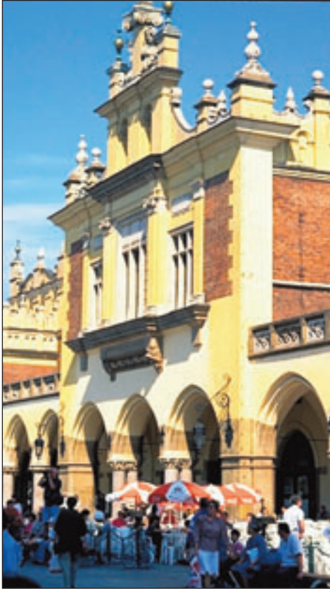
Cracovie, l'ancienne capitale des rois de Pologne. Parfum d'histoire...

S i le phénomène a commencé il y a quatre ou cinq ans, la tendance se confirme fortement cette année : les pays de l'Europe centrale ont la cote. Relativement proches de l'Hexagone, ces nations tout juste devenues membres de l'Union européenne, bouillonnant