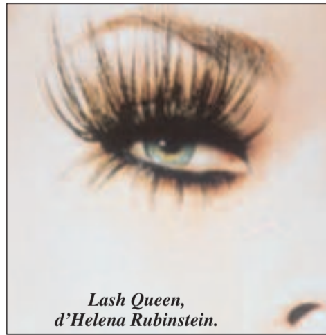
Lash Queen, d'Helena Rubinstein.

Spider Eyes d'Helena Rubinstein - 25 euros, dans les grands magasins et en parfumeries.