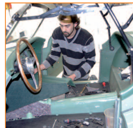
Cet artisan sellier, passionné par son métier, a trouvé chez Cecil cars l'exigence qui correspond à la minutie de son travail.

cars propose aussi les indispensables révisions mécaniques, sans oublier ses activités de conseils auprès des assurances, de location de véhicules pour le cinéma ou les expositions en salons. Bref, de multiples activités autour de la voiture ancienne qui ont permis à cette entreprise familiale d'être